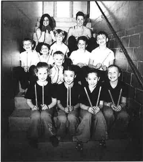
Die Tanzgruppe machte den Auftakt zum 25 jährigen MUKI-Jubiläum.