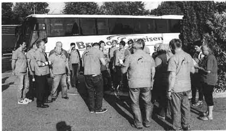
Zwischenhalt auf der Autobahnraststätte...