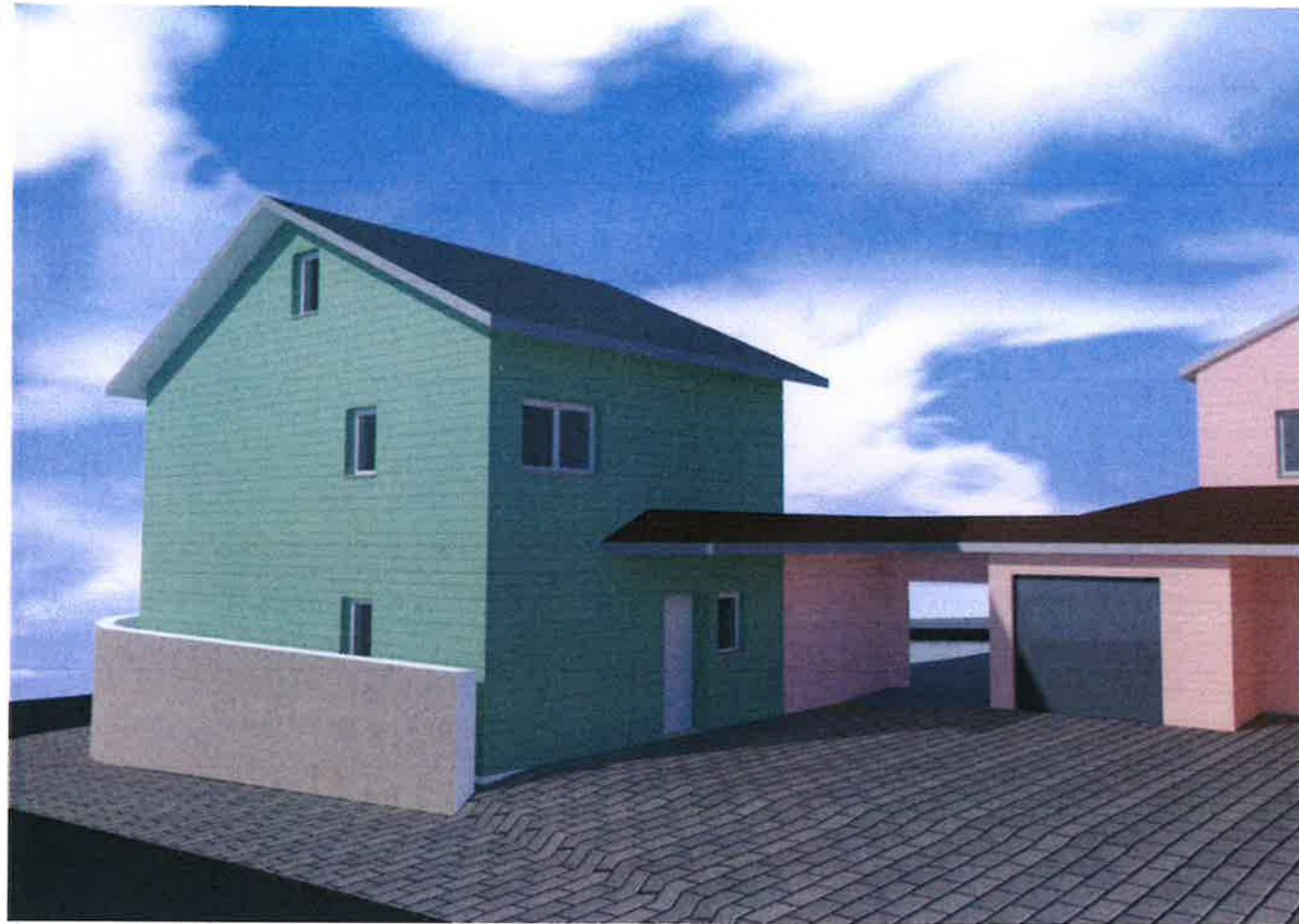
Perspektive Zusammenbau Ost