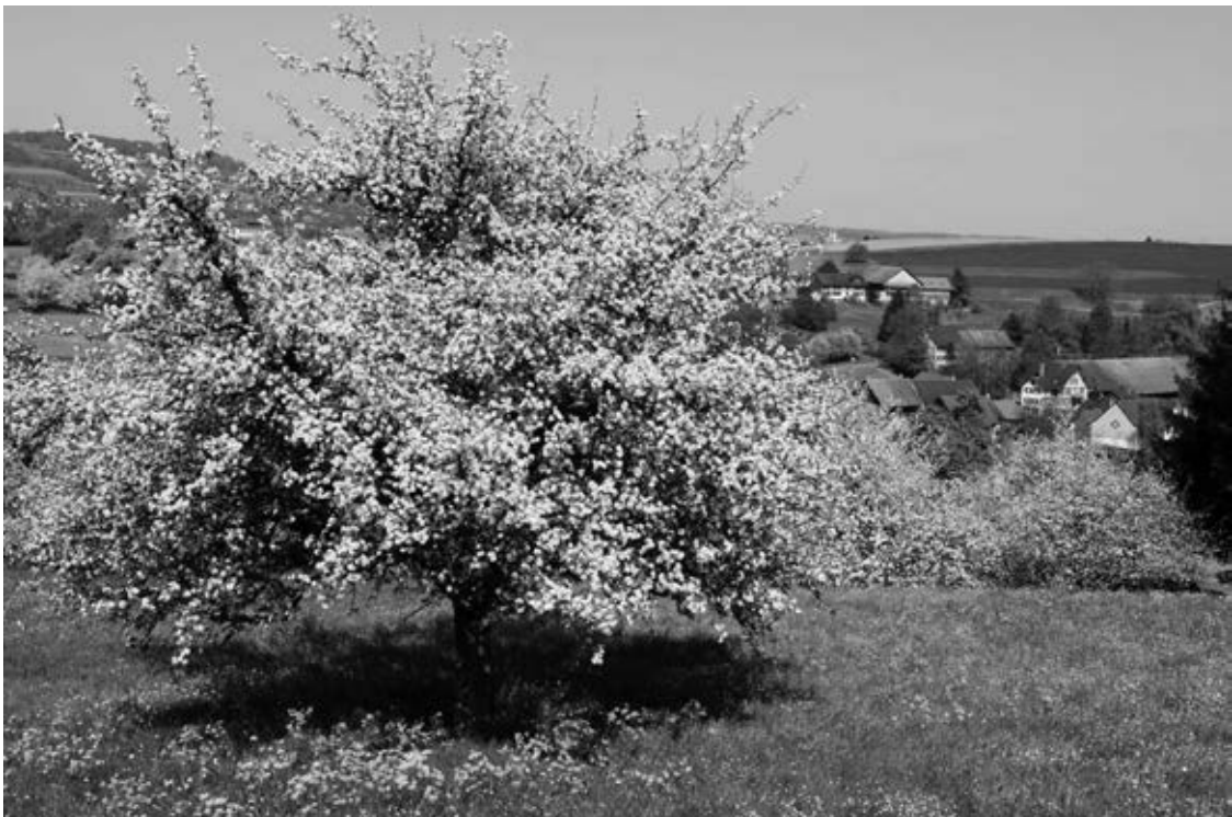
Bilder: Peter Moser-Kamm